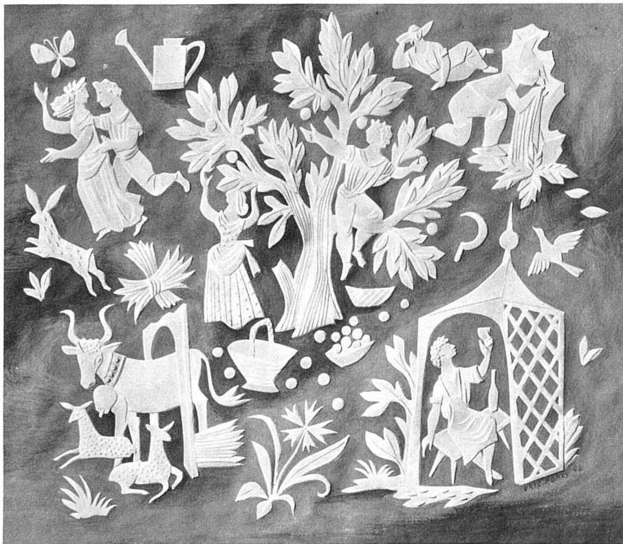
Jour de Paix