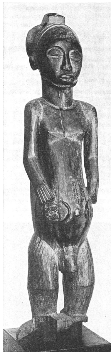
Statue der Urua, Belgisch Kongo