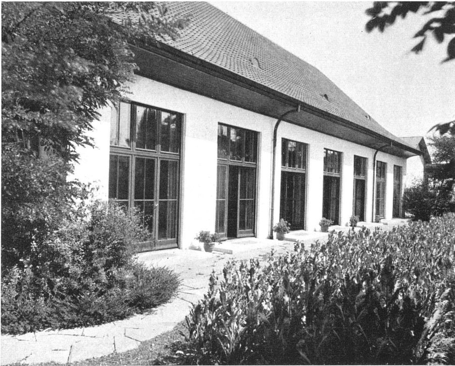
Wohlfahrtsgebäude der Waffenfabrik AG. Solothurn Oskar Sattler, Architekt SIA, Solothurn