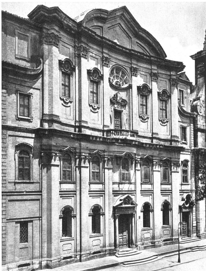
Francesco Borromini Rome, Oratorio dei Filippini

culieuses: telles de ses œuvres – les stucs du Palazzo Falconieri, la petite chapelle de San Giovanni in Oleo – ont longtemps été attribuées à la période néo-classique; on dirait que le dix-huitième siècle tout entier est exprimé par le Borromin.