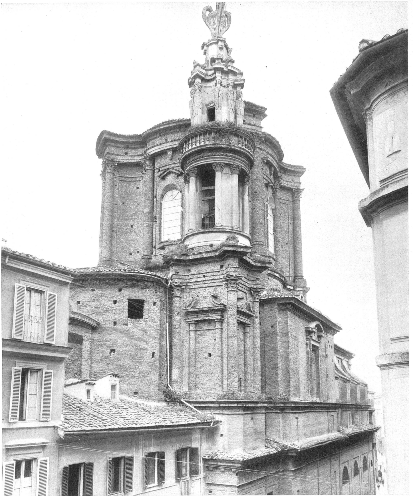
Francesco Borromini Rome, Sant'Andrea delle Fratte