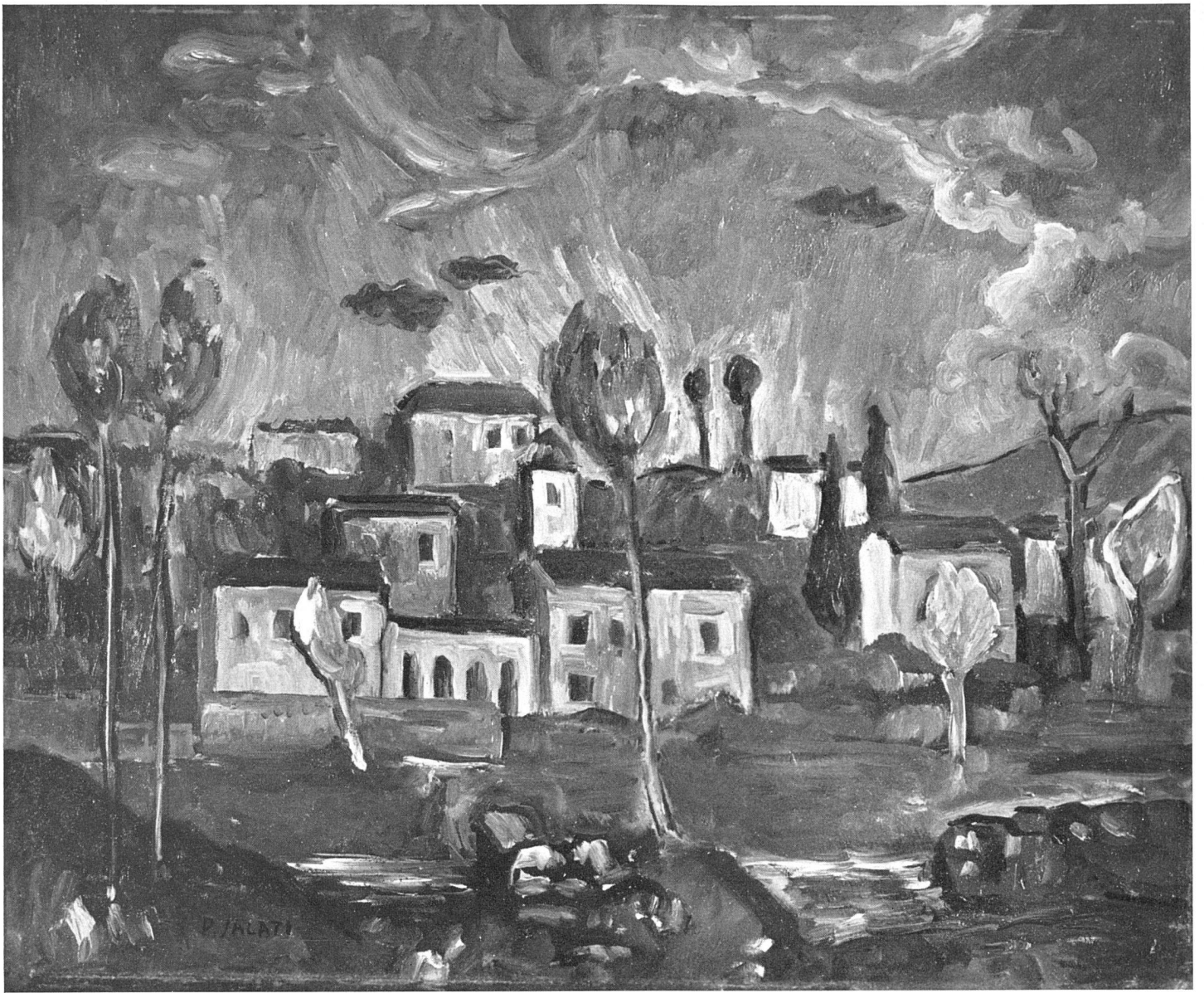
Pietro Salati Paesaggio