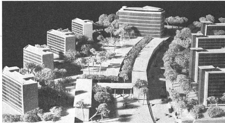
Projekt Christoph Bon: Situation, links und rechts Bureaubäude, vertiefte Verkehrsstraße mit Fußgängerpasserellen in der Mitte. Ladenstraße nur für Fußgänger mit Warenhaus als Abschluß. Parkierung zwischen Ladenstraße und Bureaubäude. Links Modell des Warenhauses