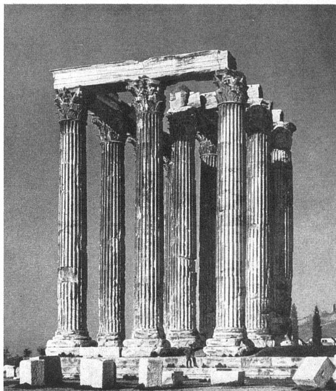
Architecture grecque. Olympion, Athènes