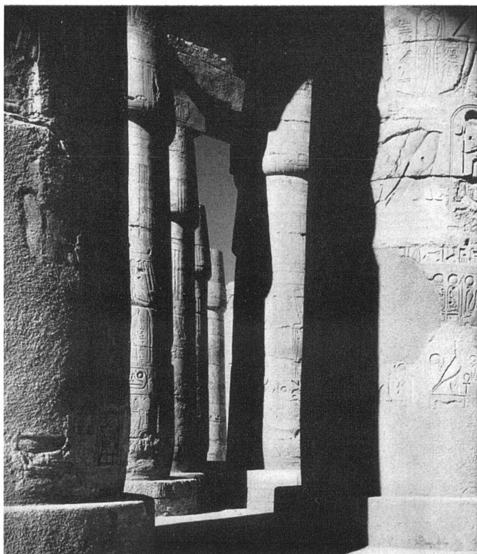
Architecture égyptienne. Ramesseum, Thèbes