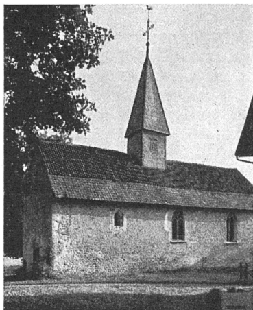
Das Äußere vor der Restauration

Diese reizende uralte Kapelle wurde im Jahre 1943 unter Aufsicht der Eidgenössischen Kommission für historische Kunstdenkmäler einer vorbildlichen Restaurierung unterzogen. Der häßliche Besenwurf, der seit dem 19. Jahrhundert das Kirchlein verunstaltete, ist entfernt und die in «Opus spicatum» gemauerten Fassaden wie-