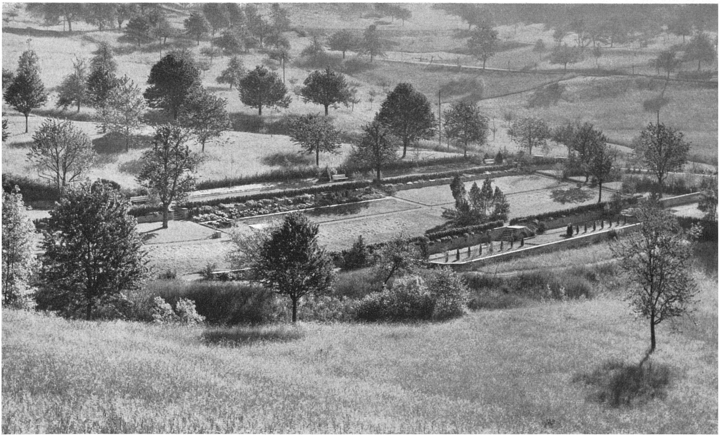
Gesamtansicht von Südosten / Vue générale du sud-est / General view from the south-east