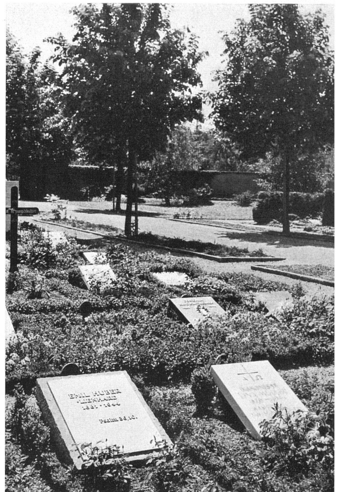
Neues Plattenfeld / Nouveau secteur à dalles couchées / New section with flat slabs