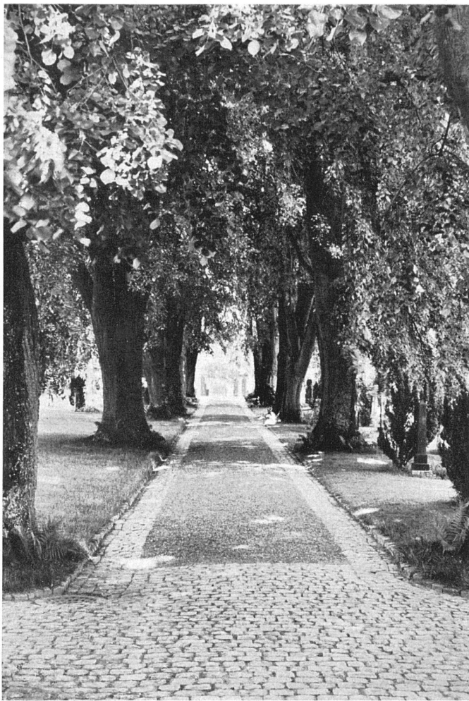
Alte Allee, seitlich Rasen und alte Gräber / Allée de vieux arbres, gazons et vieux tombeaux / Old alley, lawns and old tombs