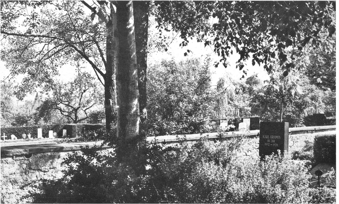
Blick vom alten in den neuen Teil / La partie nouvelle, vue du vieux cimetière / The new part, seen from the old cemetery