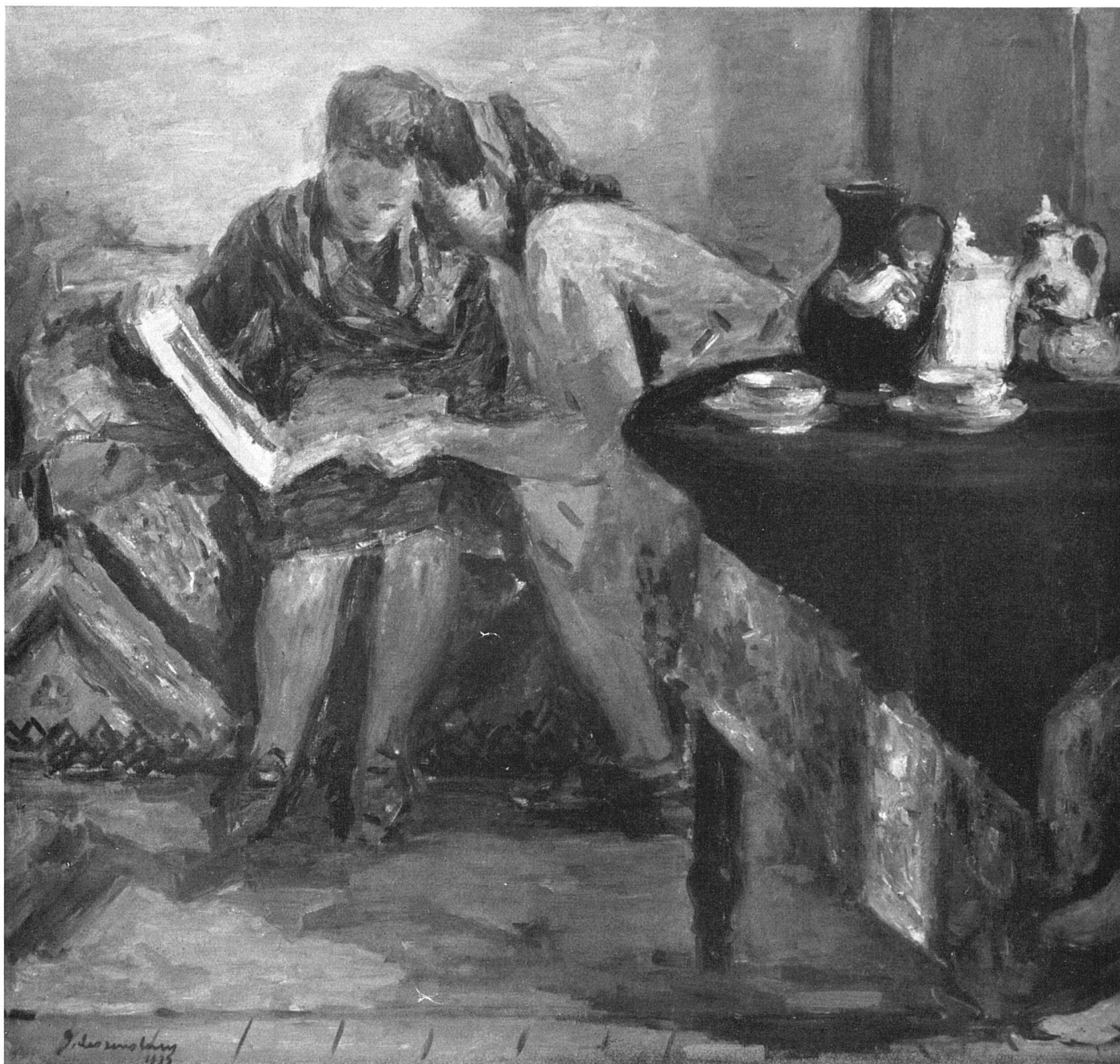
Georges Dessouslavy La lecture Kunstmuseum Aarau