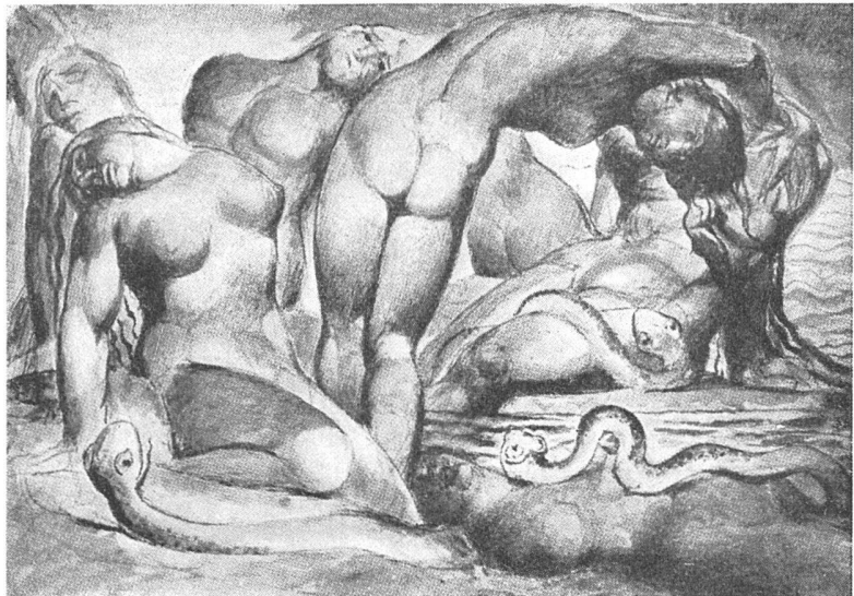
William Blake. Illustration zu Dantes Göttlicher Komödie. Zeichnung

William Blake, Maler, Radierer und Dichter, wurde in London am 28. November 1757 geboren und starb am 12. August 1827 in Fountain am Strand. Er arbeitete einen großen Teil seines Lebens fast unbekannt und in großer Not. In gewisser Hinsicht ist er ein Vorromantiker; er war aber den Romantikern in mancher Beziehung voraus; erst bei Lautréamont und neuerdings bei den Surrealisten begegnen wir einem ähnlichen introspektiv-visionären Schöpfungsprozeß. Gedanklich kann man bei Blake Beziehungen zu Jakob Böhm und Swedenborg finden, doch läßt er sich kaum summarisch in irgendein bestehendes esoterisches oder spiritualistisches Philosophiesystem einschließen. André Gide schreibt von ihm im Vorwort zum Ausstellungskatalog: «L'astre Blake étincelle dans cette reculée région du ciel où brille aussi l'astre Lautréamont. Lucifer radieux, ses rayons revêtent d'un éclat insolite les corps misérables et glorieux de l'homme et de la femme. Rayons d'autant plus maléfiques que paraissent chargés de bénédictions ...» Von rein ästhetischen Gesichtspunkten aus kann man Blake nicht beikommen. Seine Radierungen und Maleien haben oft akademischen Charak-