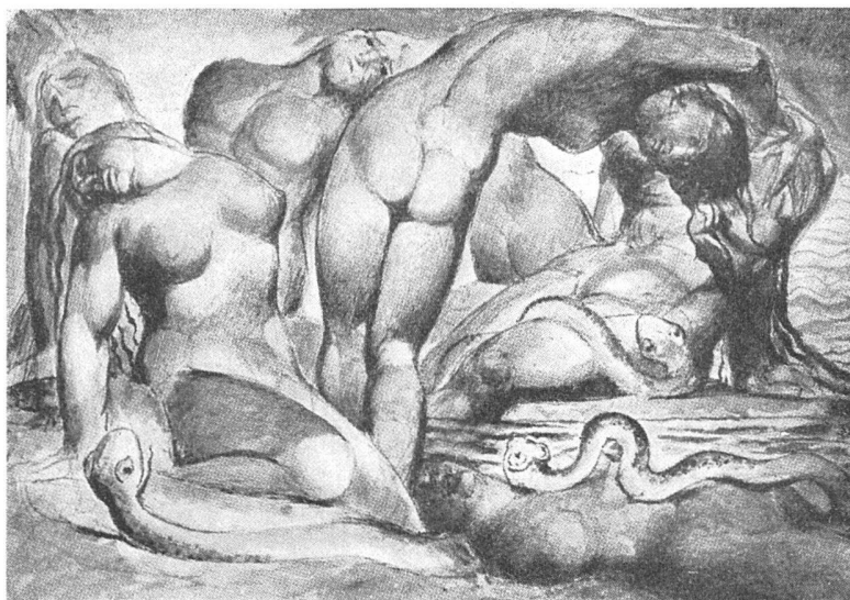
William Blake. Illustration zu Dantes Göttlicher Komödie. Zeichnung

William Blake, Maler, Radierer und Dichter, wurde in London am 28. November 1757 geboren und starb am 12. August 1827 in Fountain am Strand. Er arbeitete einen großen Teil seines Lebens fast unbekannt und in großer Not. In gewisser Hinsicht ist er ein Vorromantiker; er war aber den Romantikern in mancher Beziehung voraus; erst bei Lautréamont und neuerdings bei den Surrealisten begegnen wir einem ähnlichen introspektiv-visionären Schöpfungsprozeß. Gedanklich kann man bei Blake Beziehungen zu Jakob Böhm und Swedenborg finden, doch läßt er sich kaum summarisch in irgendein bestehendes esoterisches oder spiritualistisches Philosophiesystem einschließen. André Gide schreibt von ihm im Vorwort zum Ausstellungskatalog: «L'astre Blake étincelle dans cette reculée région du ciel où brille aussi l'astre Lautréamont. Lucifer radieux, ses rayons revêtent d'un éclat insolite les corps misérables et glorieux de l'homme et de la femme. Rayons d'autant plus maléfiques que paraissent chargés de bénédictions ...» Von rein ästhetischen Gesichtspunkten aus kann man Blake nicht beikommen. Seine Radierungen und Maleien haben oft akademischen Charak-