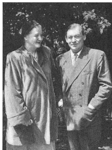
Aino und Alvar Aalto, Helsinki, in Zürich, Mai 1947