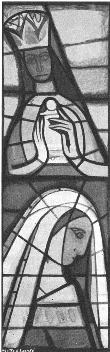
1. Preis, Detail

Die Tagung war äußerst nutzbringend für die künftige Kongreßtätigkeit wie auch für den wiederhergestellten Kontakt der Mitglieder und Landesgruppen unter sich. a. r.