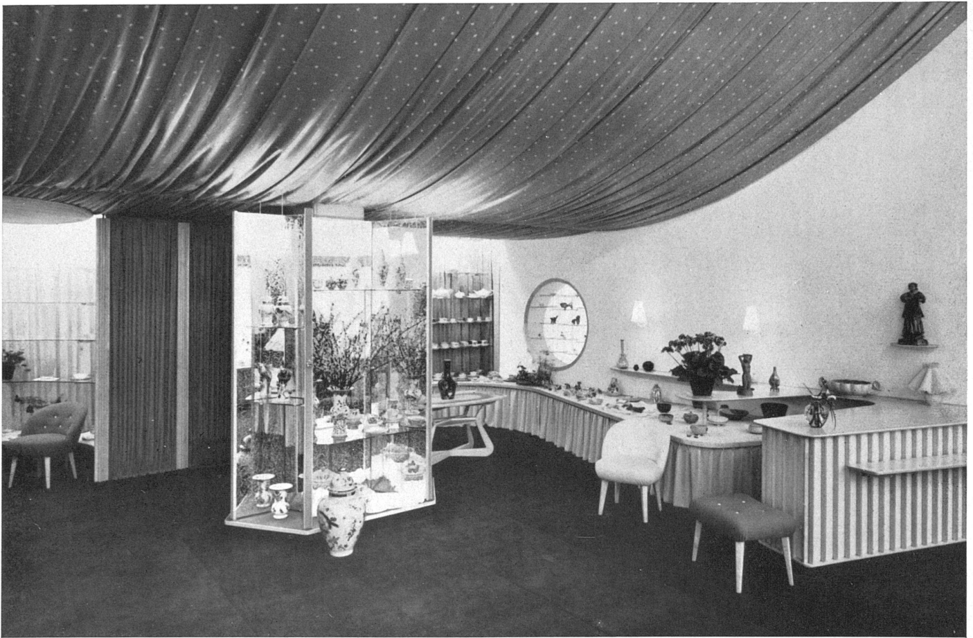
Das Ladeninnere mit Rondell und Vitrinen / Intérieur avec niche circulaire et vitrine / Interior with round recess and display case

An die mittlere Betonstütze wurde eine offene Spiegelvitrine angebaut, wodurch jene zurücktritt. Durch die mit Spiegelementen verkleidete Stirnwand gewinnt der Raum an Breite. Diese Wand zieht gleichzeitig den Blick der Passanten auf der Bahnhofstraße an. In einem amüsanten Rundpavillon werden vor allem Kristallgläser ausgestellt. Der Bodenbelag besteht aus dunkelbraunem Spannteppich und die das vorhandene Zwischengeschoß verdeckende Decke aus hellblauem Stoff mit weißem Sternmuster. Der Kristallpavillon ist mit hellgelbem Stoffe umkleidet. Die Schreinerarbeit ist in ausgesuchtem hellem Ahornholz ausgeführt.