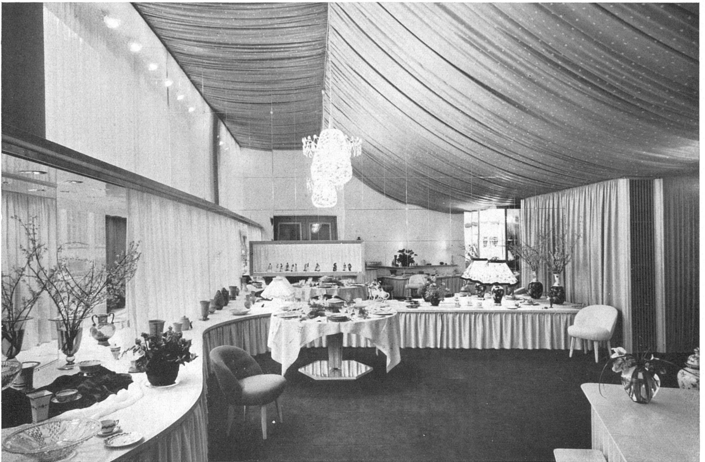
Das Ladeninnere in Zürich, Spiegelrückwand | Intérieur; paroi de glace au fond | Shop interior; large mirror at the back