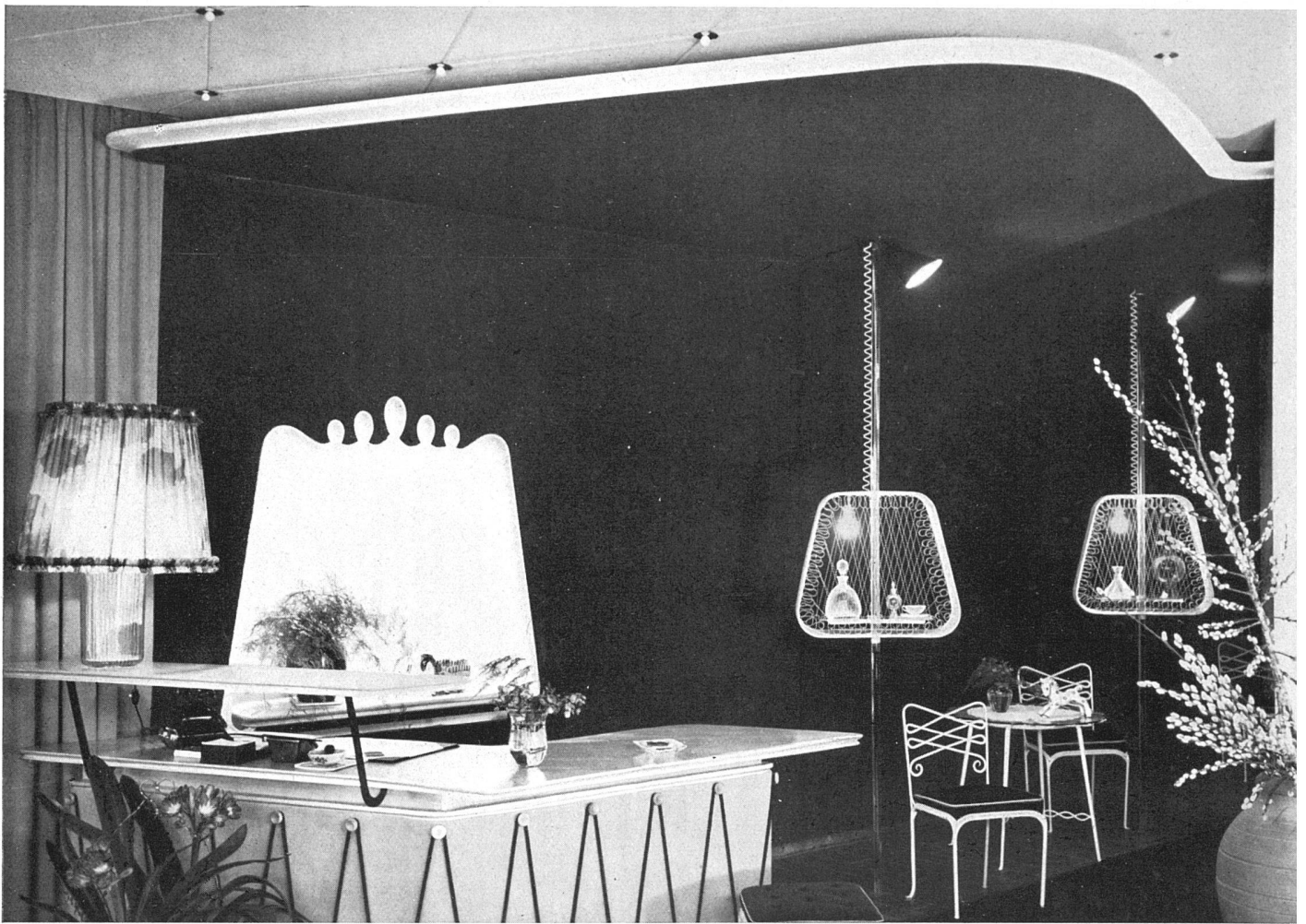
Das Ladeninnere mit Nische in Luzern, rechts offene Vitrinen | Intérieur et niche; à droite vitrines ouvertes | Interior with recess; at right open display cases Ausstellungstafel | Tablette d'étalage | Display board