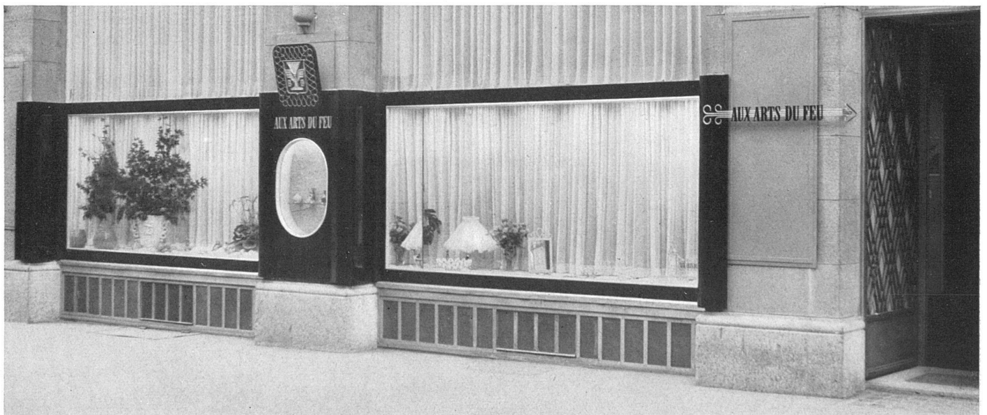
Schaufensterfront in Zürich | La devanture | The display windows

Die Schaufensterfront mußte als solche unverändert übernommen werden. Die demontable, schwarzlackierte Metall-einfassung bindet jedoch die beiden Schaufenster zu einer Einheit zusammen. Der etwas starre Grundriß wurde durch die freie Linienführung der Ausstellungsflächen gebrochen.