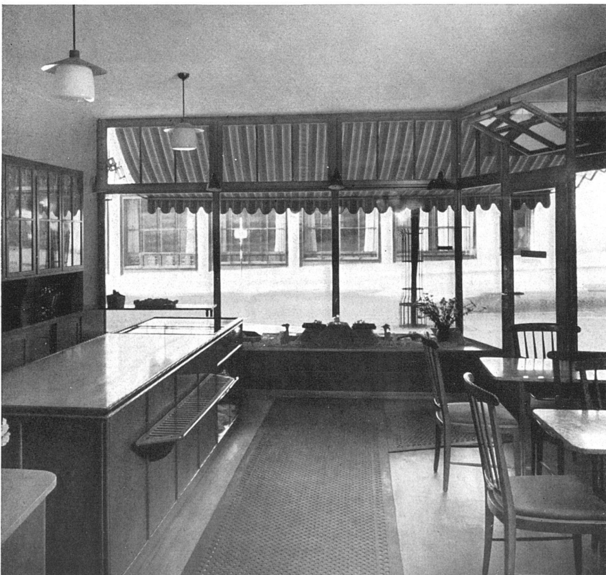
Der Confiserieladen | Intérieur de la confiserie | The interior

Die im Altstadtgebiet gelegene Liegenschaft mußte völlig umgebaut werden. Die schmale Parzelle enthält im Erdgeschoß gegen den Rhein den Tea-Room, gegen die Straße den Confiserieladen, in den vier Obergeschossen Wohnungen und im gegen den Fluß frei liegenden Untergeschoß die Betriebsräume. Konstruktion und Materialien: Die Pfeiler links und rechts bestehen aus Solothurner Kalkstein. Die Schaufensterrahmen sind in naturlackiertem Eichenholz, die unteren Füllungen in weißem Opakglas ausgeführt. Die Sonnenstoren sind blau und weiß gestreift. Für die inneren Schreiner- und Ausbaurbeiten wurde Kirschbaumholz verwendet, für die Möbelbezüge blaue und gelbe Leinen und für die Vorhänge blau und gelb gestreifter Chintzstoff. Die Decke des Tea-Rooms ist hellblau gestrichen mit sgraffitoartigen Malereien von Joos Hutter , Basel.