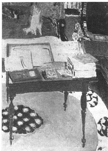
Pierre Bonnard, La table de travail

Im großen Saal wohnen wir der harmonischen Entwicklung von Bonnards Malerei bei, die, anfangs noch tonig,