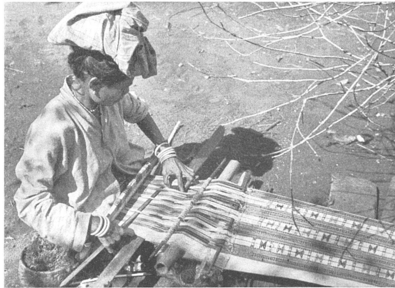
Frau von holländisch Mittel-Timor beim Weben eines broschierten Stoffes.

Die erste Gruppe der Gewebe selbst umfaßte Gewebe mit Grundbindungen. Es waren größtenteils einfache Alltagsgewebe aus Faserstoffen, Baumwolle oder Seide, ungefärbt oder gefärbt, einfarbig oder mit einzelnen gefärbten Kett- und zum Teil auch Schußfäden, wodurch gestreifte und karierte Musterungen entstehen. Als Farbmaterial