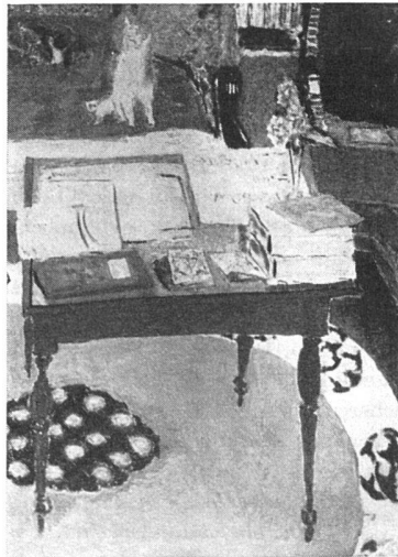
Pierre Bonnard, La table de travail

Im großen Saal wohnen wir der harmonischen Entwicklung von Bonnards Malerei bei, die, anfangs noch tonig,