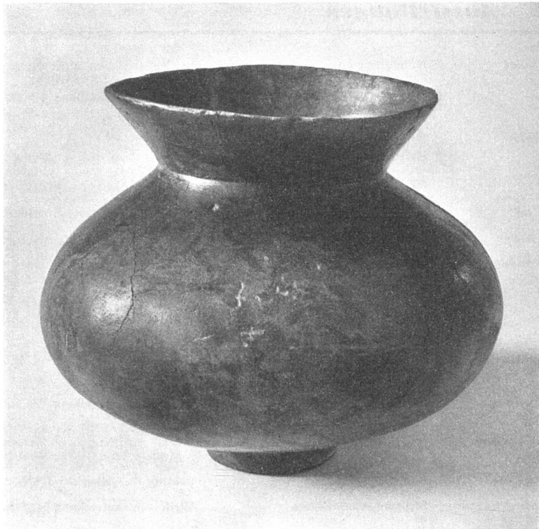
Gefäß aus Ossingen. Späte Bronzezeit (ca. 9. Jahrhundert v. Chr.). Aus der Keramik-Ausstellung des Kunstgewerbemuseums Zürich.

tionen oft streng-mathematische Zeichen, Jürg Spiller in seinem leuchtenden «Zwischen Tag und Nacht»-Bild ausschließlich elementare farbige Stäbchen – hier allerdings als raumillusorische Faktoren. Walter Bodmer durchsetzt seine menschlich-mechanischen Schwebewesen gleichzeitig mit sachlicher Konstruktion und bizarrer Phantastik, so wie auch J. Farners luftige Freiplastiken, aus gelenkig-gefügt Holzstäbchen klar gebaut, nicht der ironischen Note entbehren. Man könnte gerade diese Untersuchungen noch weiter führen, auch jenseits der Ausstellungsbeispiele. Interessant, nicht aus formalen Gründen, sondern als Symptom, als geheimer Hinweis auf ein mögliches Zusammenfließen dieser vielfältigen optischen Sprachregionen zu einem – wohl noch zukünftigen – komplexen Sprachganzen. C. G. W.