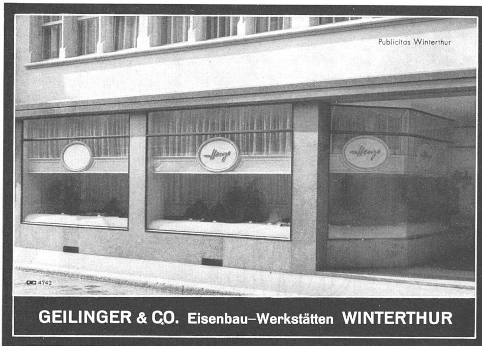
GEILINGER & CO. Eisenbau-Werkstätten WINTERTHUR