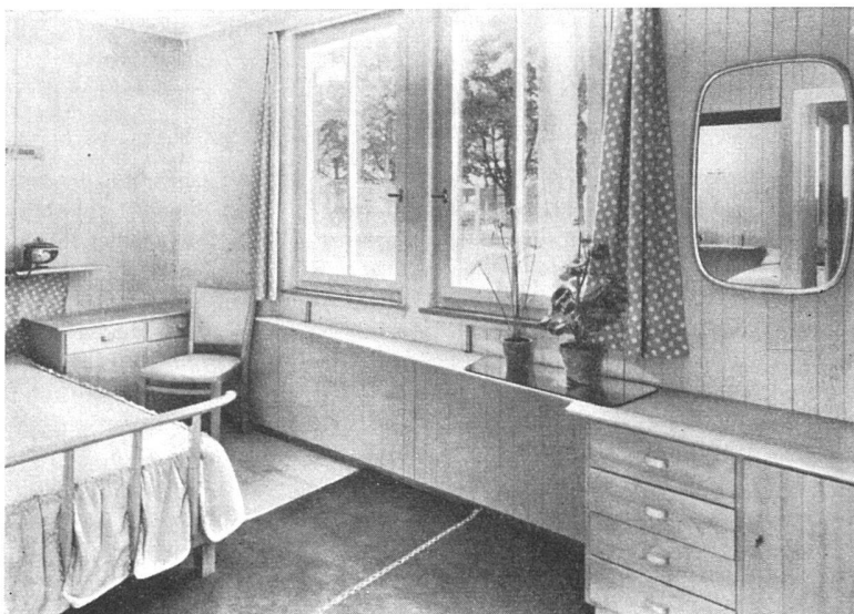
Vorfabriziertes Holzhaus «Cottage» der Genossenschaft für bernische Export- und Siedlungshäuser, Bern, ausgestellt an der Exposition Internationale de l'Urbanisme et de l'Habitation, Paris 1947. Architekten: H. Schwaar BSA, H. und G. Reinhard BSA, Bern. Möbel der Firma Anliker, Langenthal

Verfasser oft und oft auf die immerwährenden Geldwertschwankungen zu sprechen kommt – den Grund der Gründe eben jener Schwankungen der Wohnungsproduktion –, glaubt er doch, die Regulierung der Wohnungsproduktion und nicht der Herstellung von Zahlungsmitteln empfehlen zu sollen. So begrifflich ein derartiges Verlangen ist, – es wäre doch wohl richtiger, alles zu tun, damit die Reglementierung der Kriegszeit abgebaut werden können und nicht aufgebaut. B.