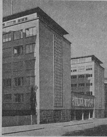
TT-Verwaltungsgebäude Bern Eidg. Baudirektion und Paeder & Jenny, Arch. BSA, M. Steffen, Arch. SIA, Bern