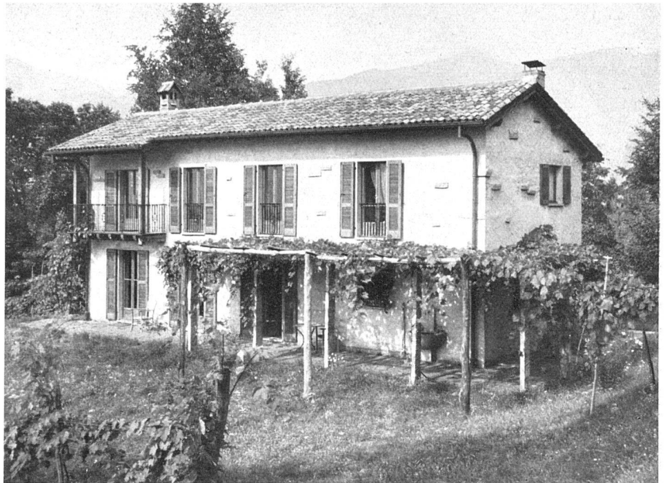
Gesamtansicht / Vue d'ensemble / General view

Einfache, aus dem traditionellen Tessinerhaus entwickelte räumlich gute Lösung / Petite maison de campagne en style régional; claire disposition des locaux / Small country house in somewhat traditional style with good plan