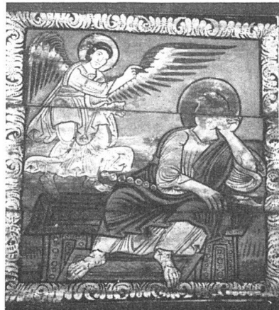
St. Martin in Zillis. Detail von der romanischen Decke: Josephs Traum Oben: vor der Restaurierung, unten: nach der Restaurierung von 1940/41