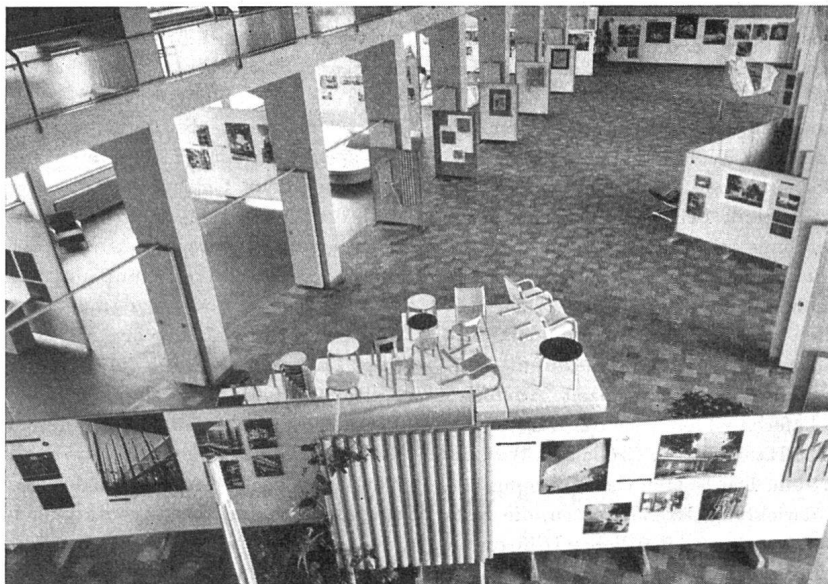
Blick in die Aalto-Ausstellung im Kunstgewerbemuseum Zürich.

Neben den vielen Architekturmodellen und Photos bereicherten Möbel und Konstruktionsmodelle im Maßstab 1:1 sowie die von Aalto entworfenen Vasen die Ausstellung auf äußerst lebendige Art und vervollständigten das