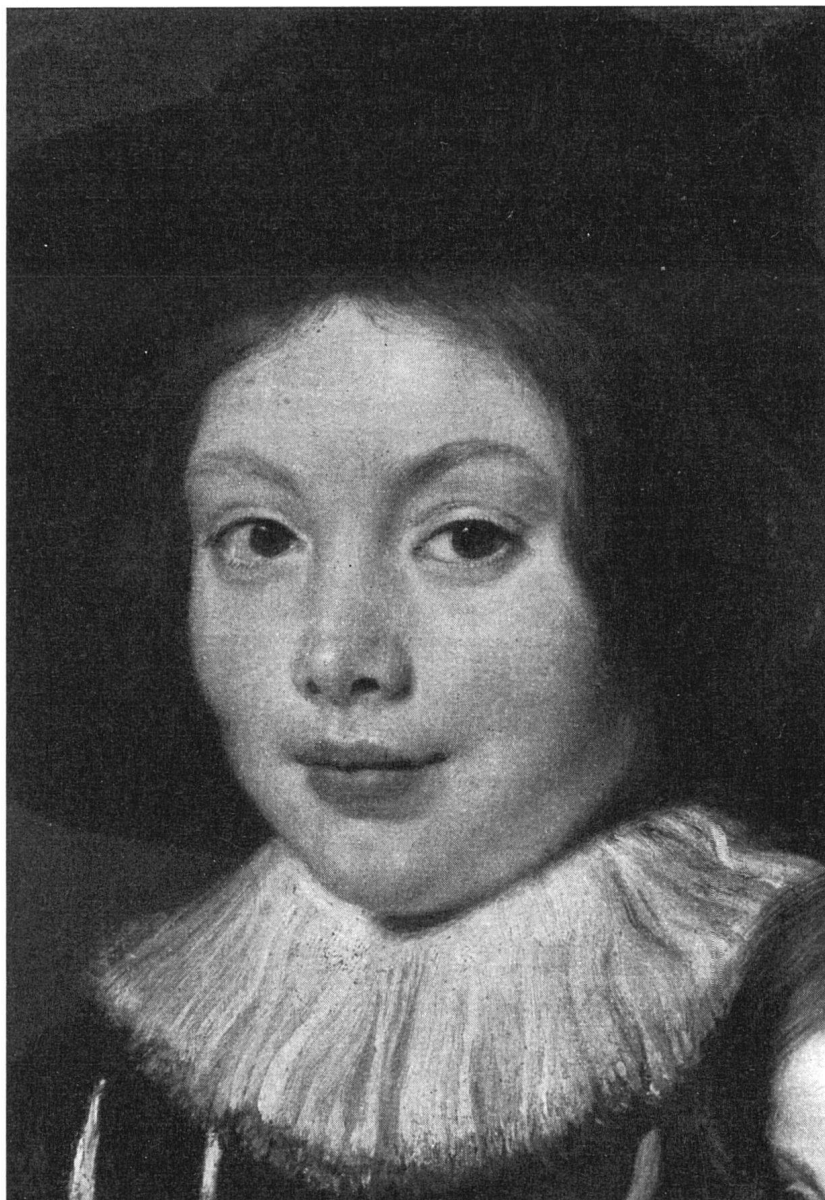
Peter Paul Rubens, Bildnis der Söhne des Künstlers (Detail). Sammlungen des Fürsten von Liechtenstein

dern auch ansehnliche mäzenatische Leistungen zur Voraussetzung hat. Mehr als in andern großen Privatsammlungen Europas verspürt man in der Liechtenstein-Galerie eine Leidenschaft des Mäzenatentums und des Sammelns, die jahrhundertlang von Generation zu Generation überliefert und kultiviert worden ist. Besonders seit dem Beginn des 17. Jahrhunderts hat jeder der fürstlichen Sammler sein eigenes Profil. Da ist zuerst jener Karl , der nachmalige Vizekönig von Böhmen, dessen Sammlungen schon den Neid Kaiser Rudolfs II. erweckten, und der sich besonders für Gemmen und Edelsteingefäße interessierte. Ihm folgt Karl