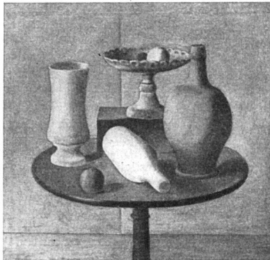
Giorgio Morandi, Stilleben , 1920