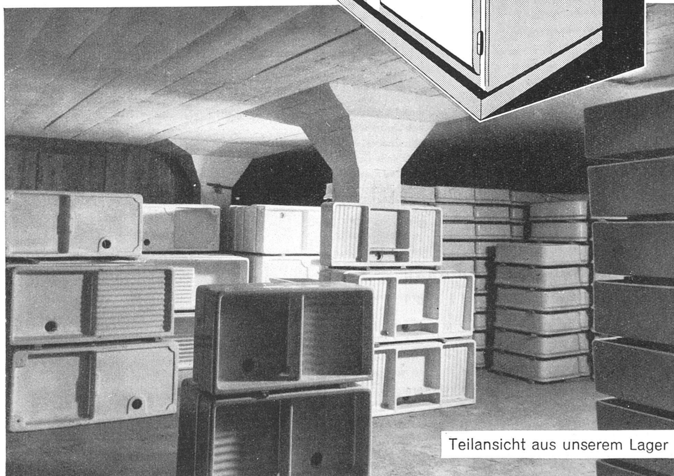
Teilansicht aus unserem Lager