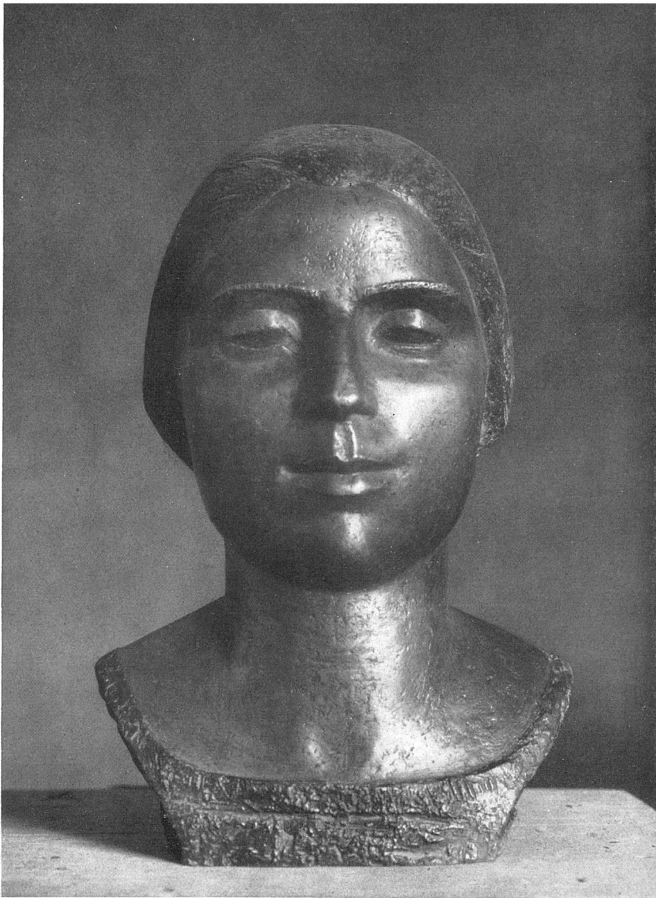
Emy Roeder, Frauenkopf. Bronze, 1937 / Tête de femme / Head of Woman

diges ist entstanden im jeweils gegebenen Material, in Holz, Bronze, Terracotta oder Stein. Und es ist ein Neues: das Vorbild hat sich verwandelt, das Neue lebt sein eigenes Leben als Kunstwerk, keine Abschrift und keine Nachahmung der Wirklichkeit oder der Natur, nicht ihr Duplikat, sondern ihr Gleichnis.