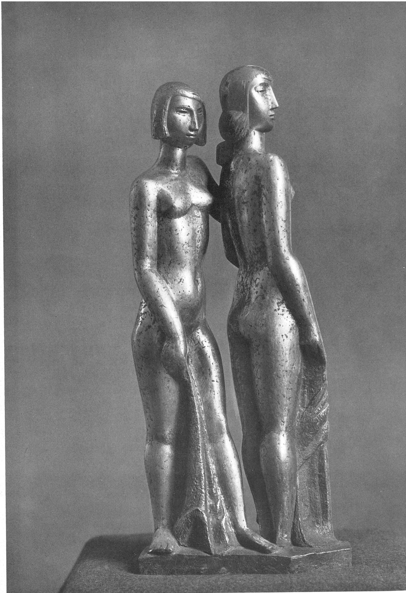
Emy Roeder, Zwei Mädchen. Bronze, 1940/41 | Deux jeunes filles / Two Girls