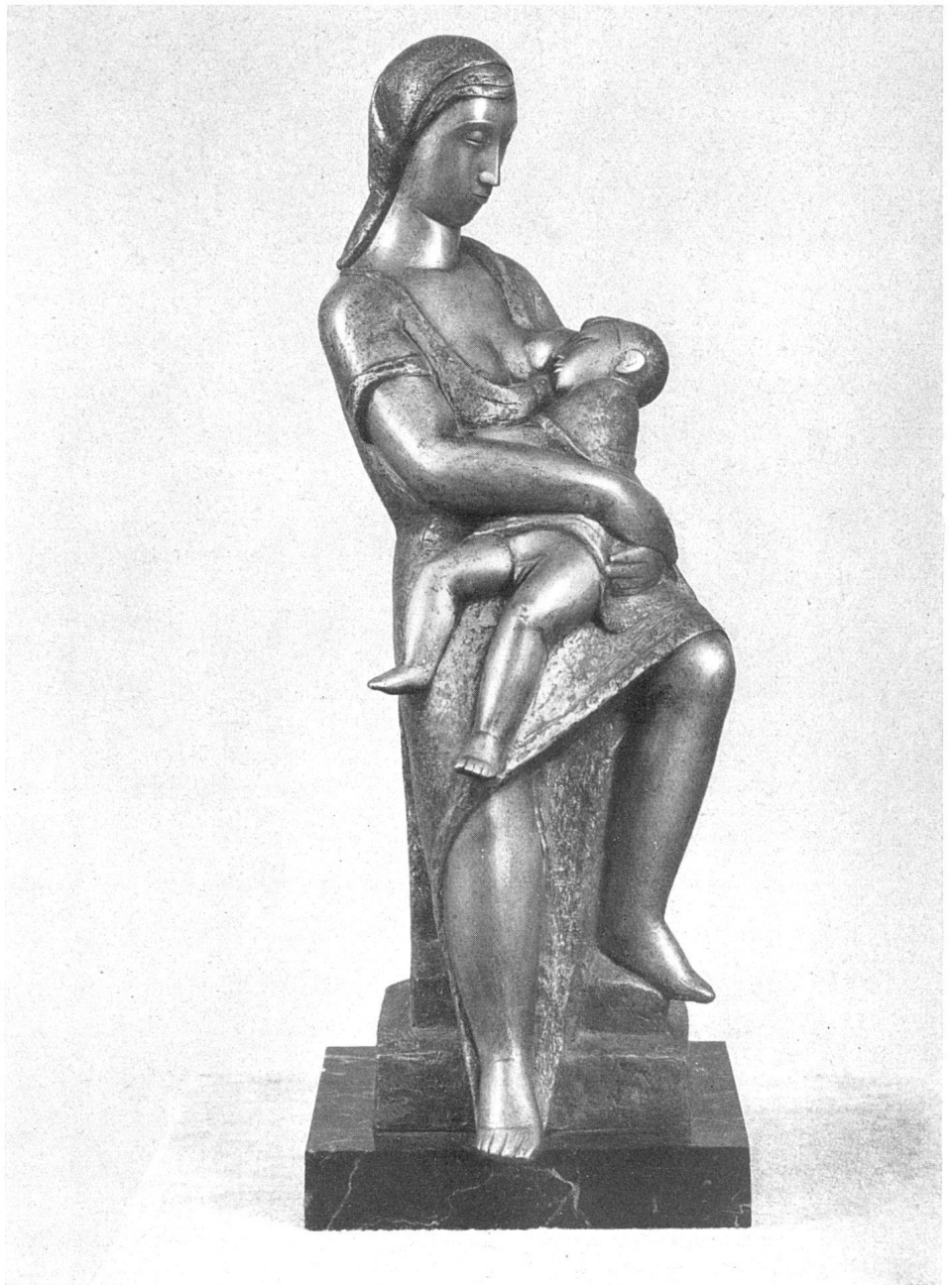
Emy Roeder, Mutter mit Kind . Bronze, 1943 | Mère et enfant / Mother and Child

Freundschaft, Hingabe – wir verspüren den lebendigen Hauch ruhenden Daseins, friedlich in sich selbst beschlossenen Soseins von Mensch und Tier.