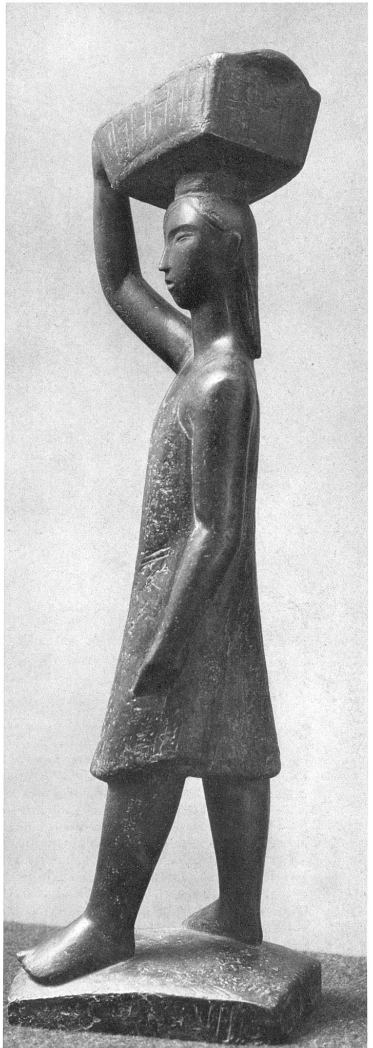
Emy Roeder, Mädchen mit Korb. Bronze, 1938/40 | Jeune fille au panier | Girl with basket

Emy Roeder ist eine Bildhauerin besonderer Begabung und Begnadung. Ihre Arbeit beginnt mit der unablässigen, liebevollen Beschäftigung mit dem Erlebnis. Nichts hat den unpersönlichen und unverbindlichen Charakter eines Objekts oder Modells. Das Erlebnis gewinnt unter ihren gestaltenden Händen in vielen Flächen und Tiefen, Rundungen und Ecken, in Status und Motus zeichnerische oder plastische Form. Dann wird der Körper umrissen, umgrenzt und gewaltlos zusammengedrängt. Und es werden immer Körper erfaßt, vorgestellt, geistig und stofflich neu erschaffen, die Ordnung wollen in der Welt der Kunst, in die sie hineingeboren werden sollen, und die Hände der Künstlerin ruhen nicht, bis die Vorstellung Leben und warmen Atem gewonnen hat. Die liebevolle Beschäftigung trägt ihre Früchte: Ein Leben-