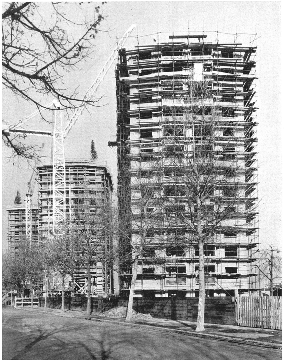
Die Wohntürme im Rohbauzustand, November 1950 | Etat présent des maisons-tours, vues du sud | Present stage of the tower houses from south