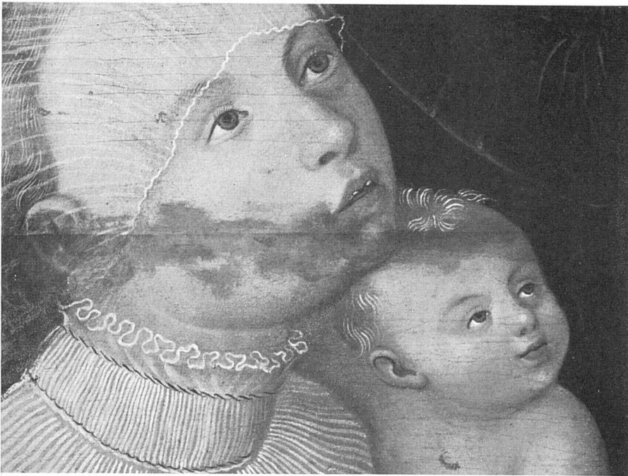
Lukas Cranach d. Ae. und Werkstatt, Jesus und die Kinder (Detail), Kunstmuseum Winterthur | Lucas Cranach le Vieux et son atelier, Jésus et les petits enfants (détail) | Lukas Cranach the older and studio, Jesus and the Children (Detail)

Einer Holzfuge entlang gehen breite nachgedunkelte Retuschen. Sie sind, wie viele alte Retuschen, wesentlich umfangreicher als notwendig / Le long d'un joint, de larges retouches foncées par le temps. Ces retouches, comme nombre de retouches anciennes, sont beaucoup plus considérables qu'il n'est utile / Along a joint, the broad retouchings have darkened. They are, as many old retouchings, much more extensive than necessary