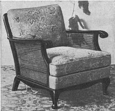
Die ersten mottensicheren Polstermöbel