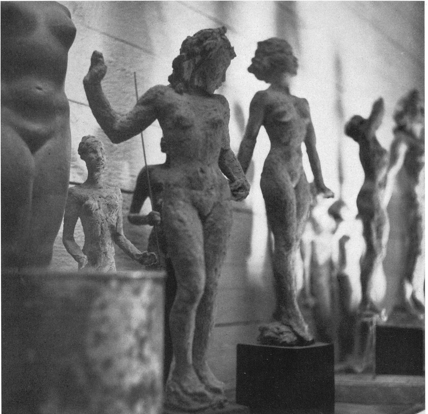
In Hermann Hallers Zürcher Atelier (um 1942) | Dans l'atelier d'Hermann Haller (Zurich, vers 1942) | In Hermann Haller's Zürich studio (about 1942)

Die Schweiz hat in Hermann Haller wohl ihren begnadetsten Plastiker verloren. Sein Werk bedeutet eine Wiedererweckung des ungebrochen Schönen aus der gesunden Sinnlichkeit des diesseitigen Daseins. Es bedeutet eine Bejahung des Lebens, die aus dem Vertrauen in das Leben und aus der Erkenntnis heraus gewonnen