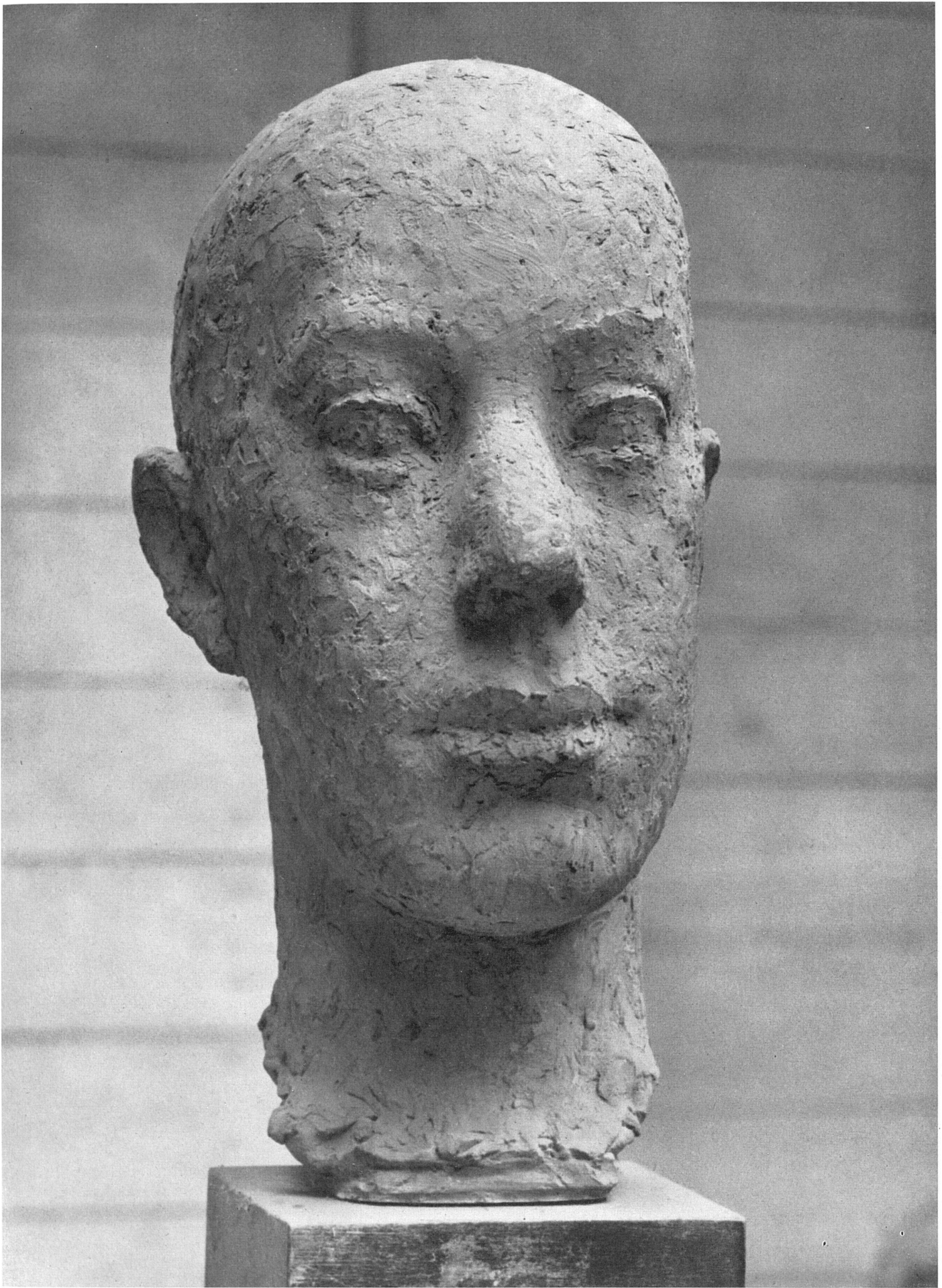
Hermann Haller, Kopf eines Spaniers, Terrakotta / Tête d'un Espagnol, terre cuite / Spaniard, terra cotta