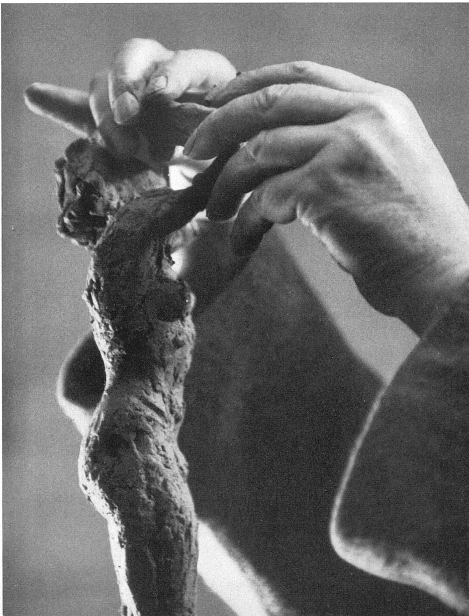
Hermann Haller modelliert | Les mains de l'artiste au travail | Hermann Haller modelling

Es ist bezeichnend, daß Haller kaum zeichnete. Jede schöpferische Regung in ihm scheint zu ihrer Befriedigung und Befreiung das plastische Material gefordert zu haben, in dem er als Bildhauer zu denken gewohnt