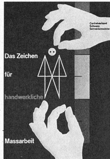
Hans Neuburg SWB, Plakat für den Centralverband Schweiz. Schneidermeister, hervorgegangen aus einem vom SWB unter 5 Graphikern durchgeführten Wettbewerb

Die Fülle des im Buche dargebotenen Materials zeigt, wie breit der Interessenbereich und das Talent Neutras gelagert sind. Die Aufzählung der verschiedenen Abschnitte des Buches, die jeweils mit einem kurzen, nach Angaben des Architekten verfaßten Textes eingeleitet werden, mag in dieser Beziehung genügen: Wohnhäuser – Mietwohnungen – Versuchshäuser, Handels- und Industriebauten – Projekte – Siedlungen. Eine Synthese der architektonischen und städtebaulichen Ziele und des baukünstlerischen Könnens des Architekten dürfte in dem neuesten Projekt für die Bebauung eines großen hügeligen und bewaldeten Geländes im Herzen von Los Angeles zustande kommen. Es handelt sich um eine Quartiereinheit für 17 000 Menschen mit verschiedenartigsten Wohntypen, Wohnbauten verschiedenster