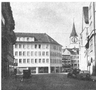
Bauten von Ernst Witschi, Arch. BSA. Geschäftshaus Münstereck, Zürich.

Verspätet erst ging Beckmann selber zu gewissen Abstraktionen der Form und Farbe über, indem er spätgotische Verspannungen in seine Kompositio-