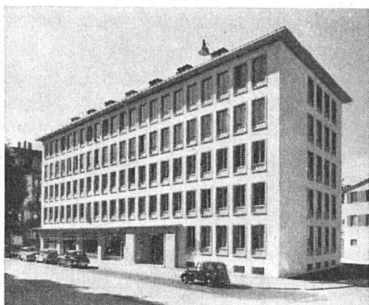
Geschäftshaus Färberhof, Zürich.

nen brachte, vielleicht unter Einfluß altdeutscher Meister, die er in Frankfurt bewunderte. So schrieb er nun ganz andere Sätze nieder, wenn er von einer «Mathematik des Ausdrucks» sprach, die sich jede Deformierung des Gegenstandes leisten könne.