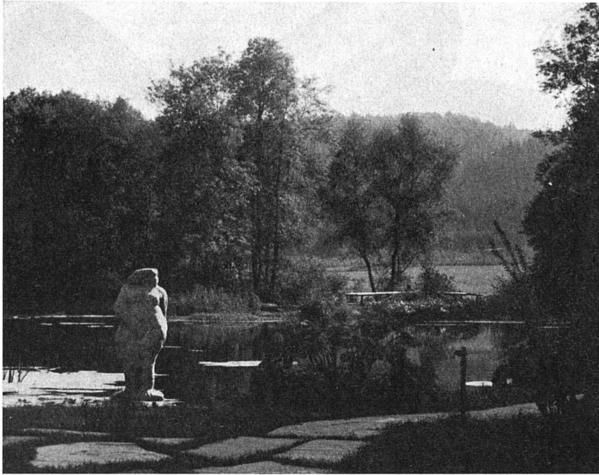
Aus dem Arboretum «In der untern Kempt»