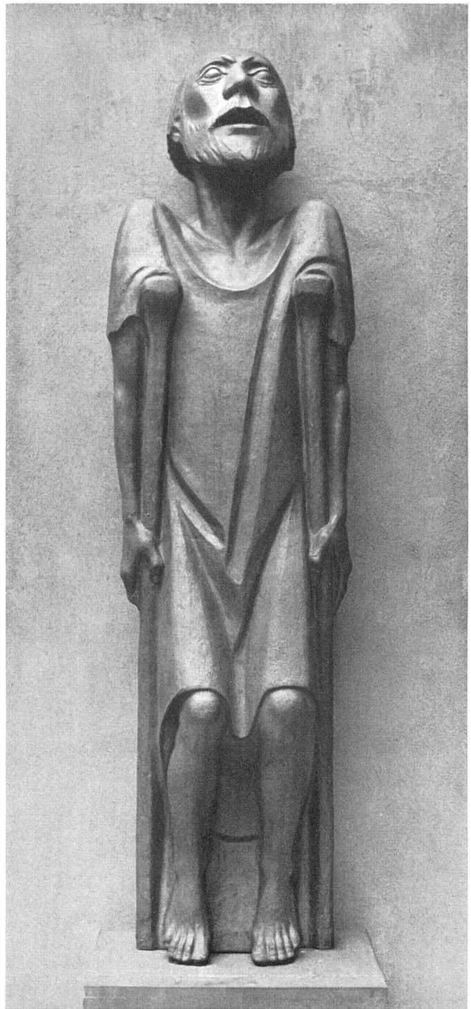
Ernst Barlach, Bettler; Fassadenfigur an der Katharinenkirche, Lübeck. Klinker, 1930 | Mendiant. Brique hollandaise | Beggar. Clinker