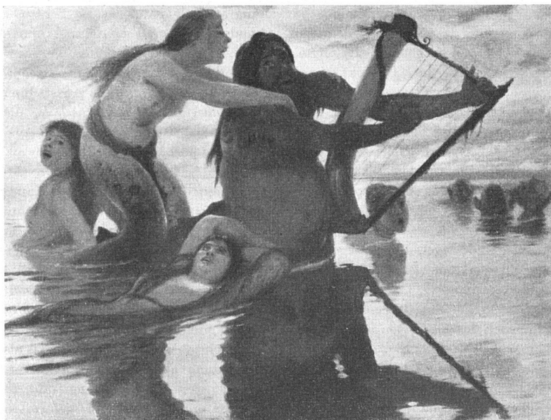
Arnold Böcklin, Im Meere (Seetingellangel) , 1884. Privatbesitz Basel

So gesehen, ist Böcklin heute für uns der vielleicht lebendigste und mit all seiner naiven Subjektivität auch der sprechendste Zeuge der zweiten Hälfte des 19. Jahrhunderts: der deutschen Spätromantik, der deutschen Italiensehnsucht und der daraus resultierenden neuen Erforschung antiker und italienischer Kunst und Kultur durch Jacob Burckhardt und Heinrich Wölfflin.