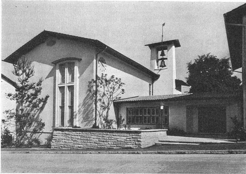
Kirche «Hoffeld» Zürich-Unterstrass