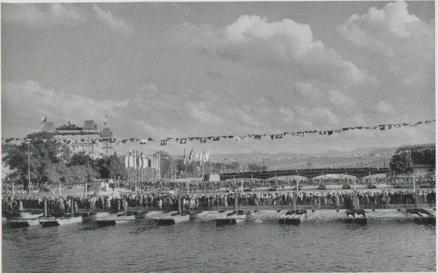
Mittelpunkt der freien Volkspromenade waren die Bellevuebrücke und die beiden Pontonbrücken | Le pont de Bellevue et les deux pontons mis à la disposition des piétons | The Bellevue Bridge and the two pontoon bridges for free use by the pedestrian