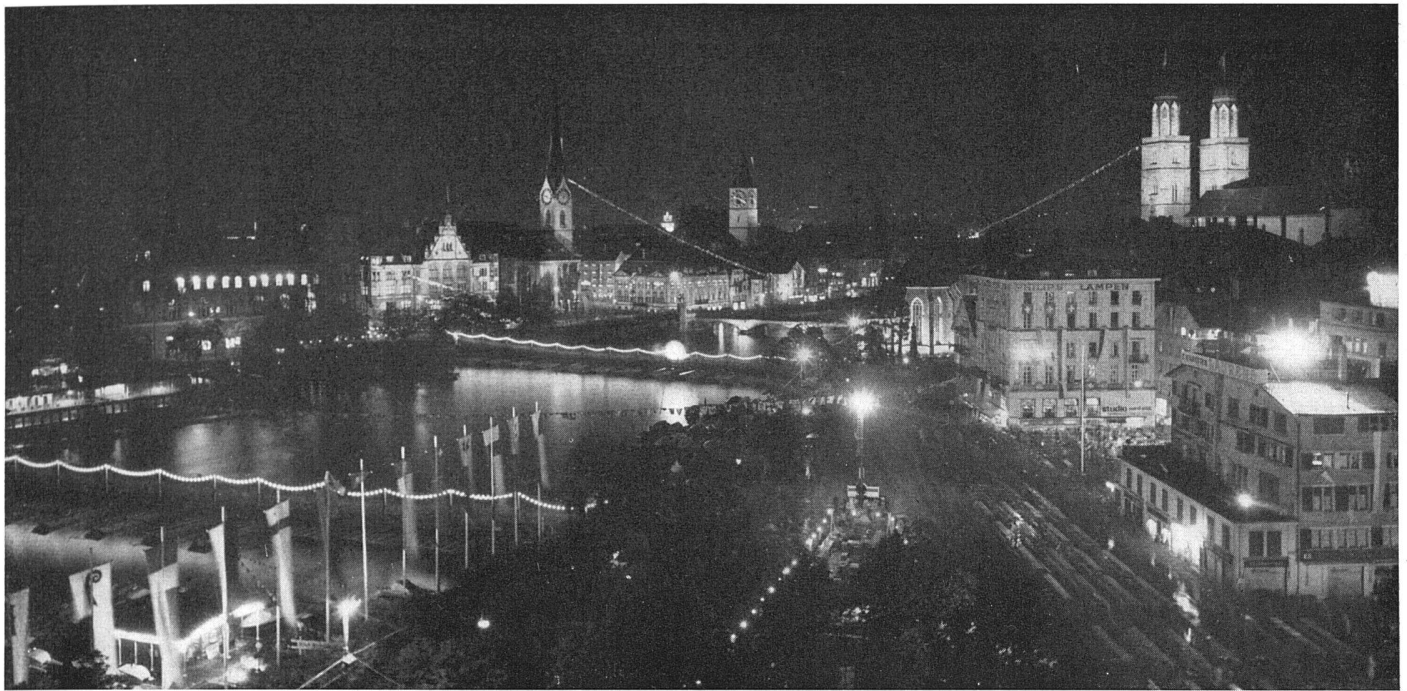
Der nächtliche Festraum | Le centre du festival la nuit | The festival centre at night