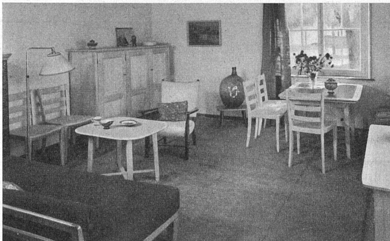
Wohnausstellung in Bümpliz-Bern. Wohnzimmer mit Möbeln von Gottfried Anliker SWB, Bern-Langenthal

Wohnungen ohnehin knapp geworden ist. Die meisten Möbel sind in schönem Tannenholz gehalten, wobei das Material mit einem glasklaren und sehr harten Überzug versehen ist. Die einzelnen Zimmer sind mit viel Phantasie behandelt; diese erstreckt sich auch auf die Lampen, die farbenfrohen Umhänge und Teppiche. Gesamthaft kommt dadurch ein einladender, wohnlicher Charakter zustande.