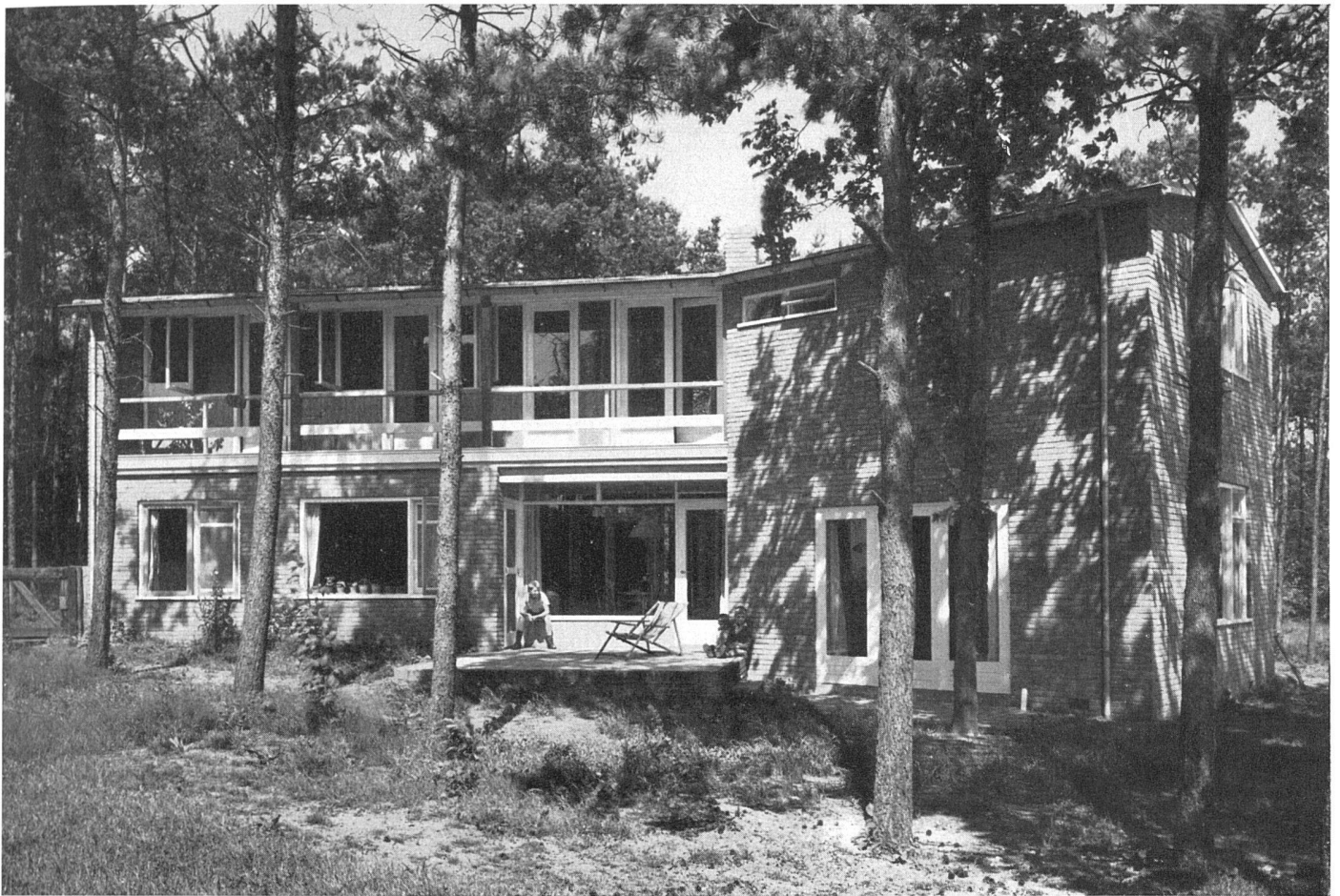
Gesamtansicht von Südosten | Vue d'ensemble prise du sud-est | General view from south-east