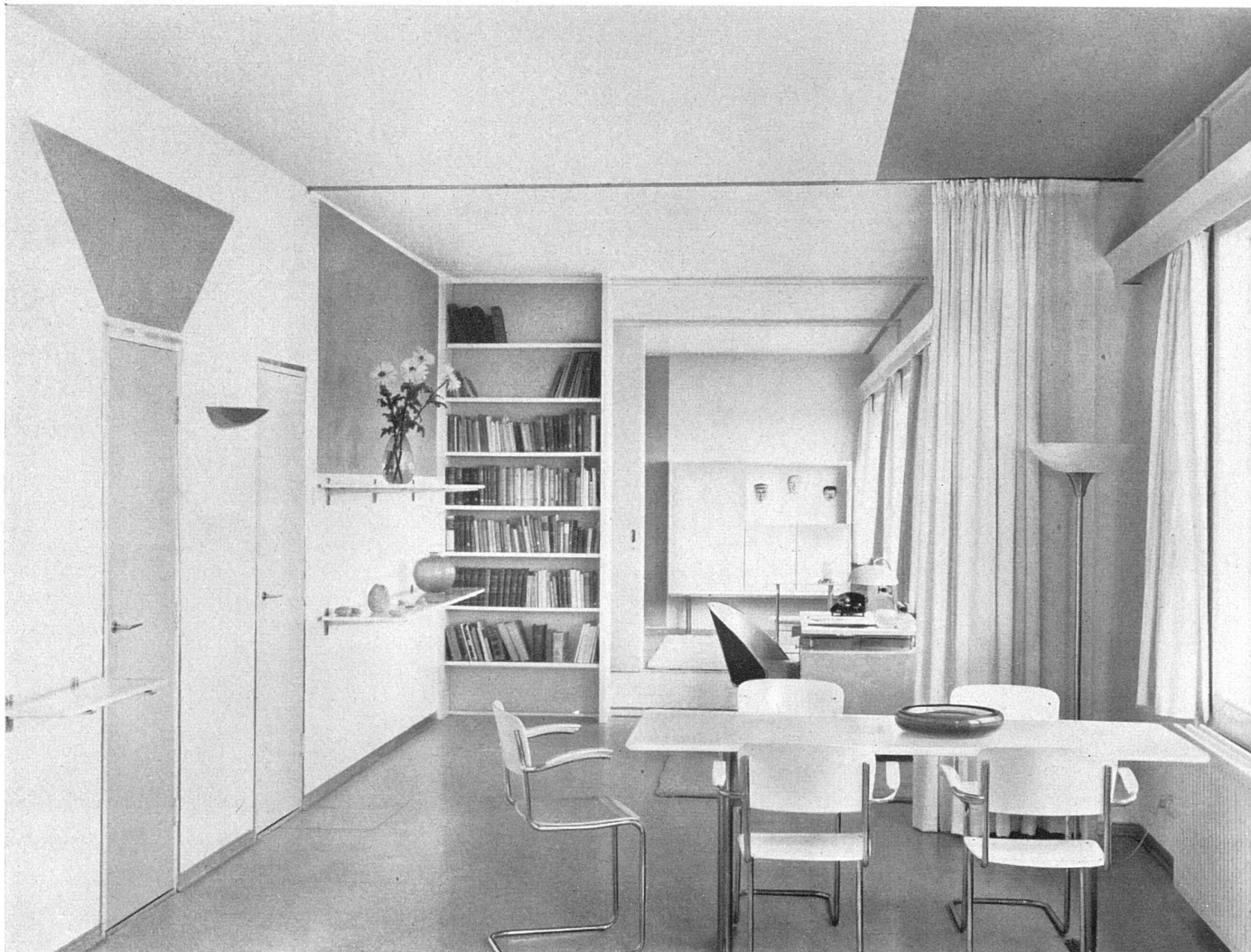
Eßplatz mit Blick nach den Schlafabteilen. Farbakzente: Türe links gelb, darüber rotes Trapez, hinten links und vorne rechts oben blau | Murs, plafon et meubles blancs avec quelques accents en jaune, rouge et bleu | Walls, ceiling, furniture are white with some yellow, red and blue accents on walls and ceiling