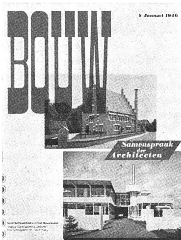
«Bouw». Wöchentliches Zentralblatt für das Bauwesen, 's-Gravenhage

Wunder zu betrachten gelernt haben: eine Welt, in der wir frei arbeiten, uns erholen und ausruhen können, unbehelligt von dem plötzlichen Heulen der über unseren Köpfen dahinbrausenden Düsenjäger.