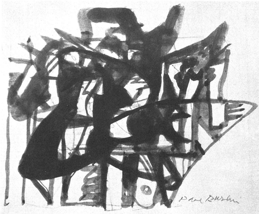
Paul Burlin, Zeichnung, 1950 | Dessin, 1950 | Drawing, 1950.