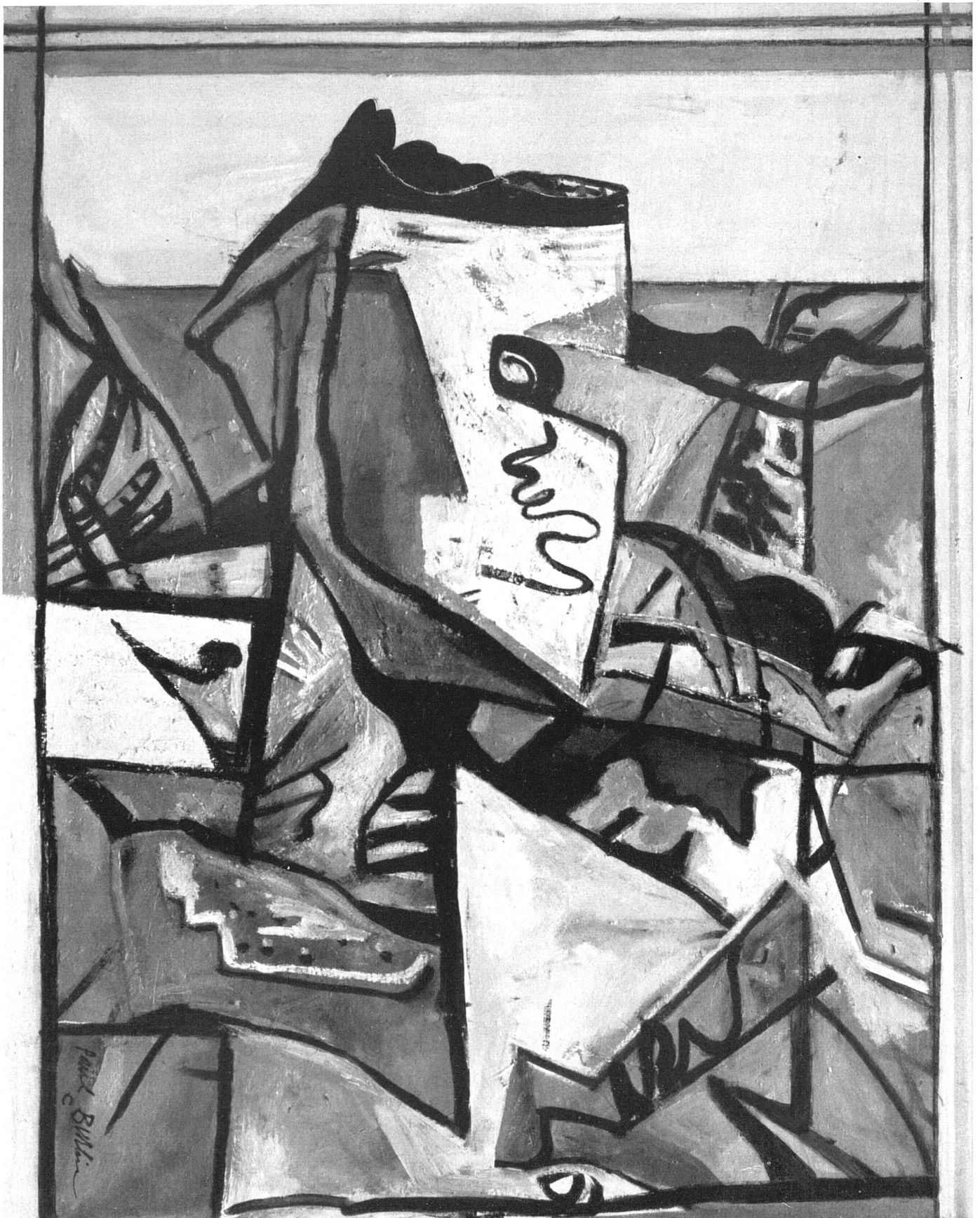
Paul Burlin, Reiter in der Dämmerung, 1947 | Cavalier à l'aube | Dawn Rider.