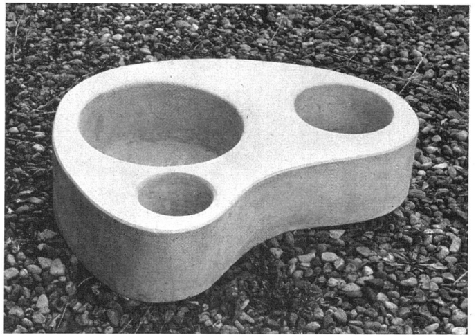
Nierenförmiges Pflanzengefäß, Modellaufnahme | Jardinière en forme de rein | Kidney-shaped plant receptacle. Photo of model

Pflanztisch | Table jardinière | Plant table