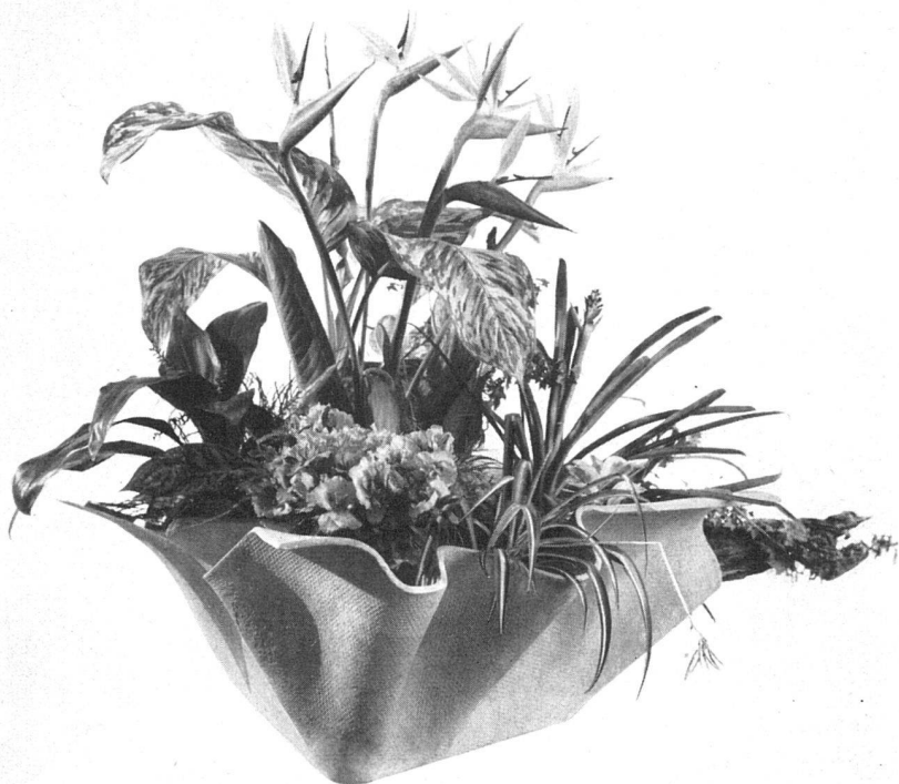
Pflanzenbehälter in freier Form | Jardinière de forme libre | Plant container in free form