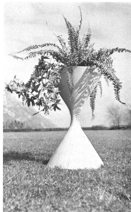
Spindelförmiger Pflanzenbehälter, Höhe 92 cm | Vasque à fleurs en forme de fuseau | Spindle- shaped plant container.