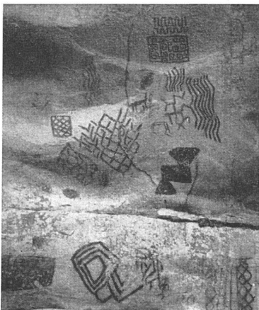
Präkolumbanische Felsenmalerei am Rio Guayabero.

jüngeren Generation, das Verständnis für diese organische Architektur immer allgemeiner. Auch die Gegenwart Wrights trug dazu bei, die Kälte zu brechen, der diese Ausstellung anfänglich begegnete.