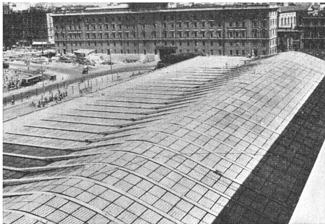
Überdeckung der Schalterhalle

Abdichtung der Anschlußfugen der Oblichter an die Eisenbeton- träger mit schwarzem IGAS- Dehnungskitt . – Ca. 14 000 m' Fugen.