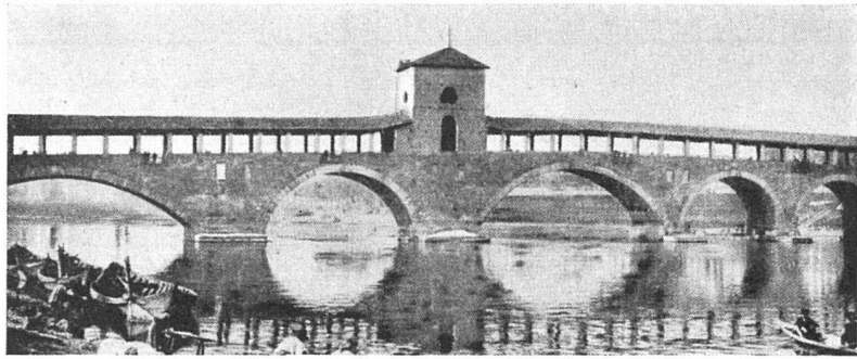
Der Ponte Coperto bei Pavia. Zustand vor 1944

Keine dieser drei Lösungen wurde gewählt, sondern ausgerechnet die einzig unerlaubte vierte: ein Wiederaufbau