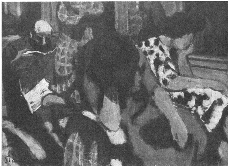
Fred Stauffer, In der Eisenbahn , 1950

Von Anfang stehen in Stauffers Schaffen die dunkeln, schweren Farbtöne da und die groß geschriebenen Umrisse, die Mensch und Naturding verdichtend