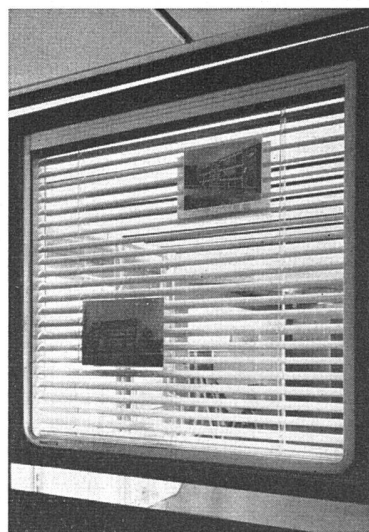
Elumin-Fenster (Schweizer Baumuster-Centrale, Zürich)