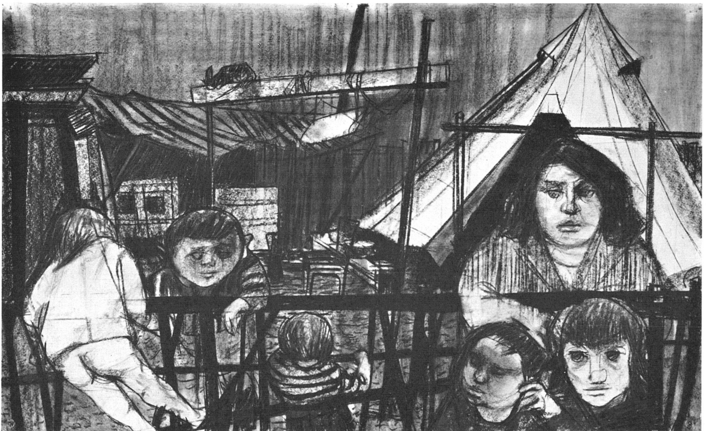
Willi Meister, In der Cité d'urgence, 1954. Kohle | Dans la Cité d'urgence. Fusain | In the Cité d'urgence. Charcoal