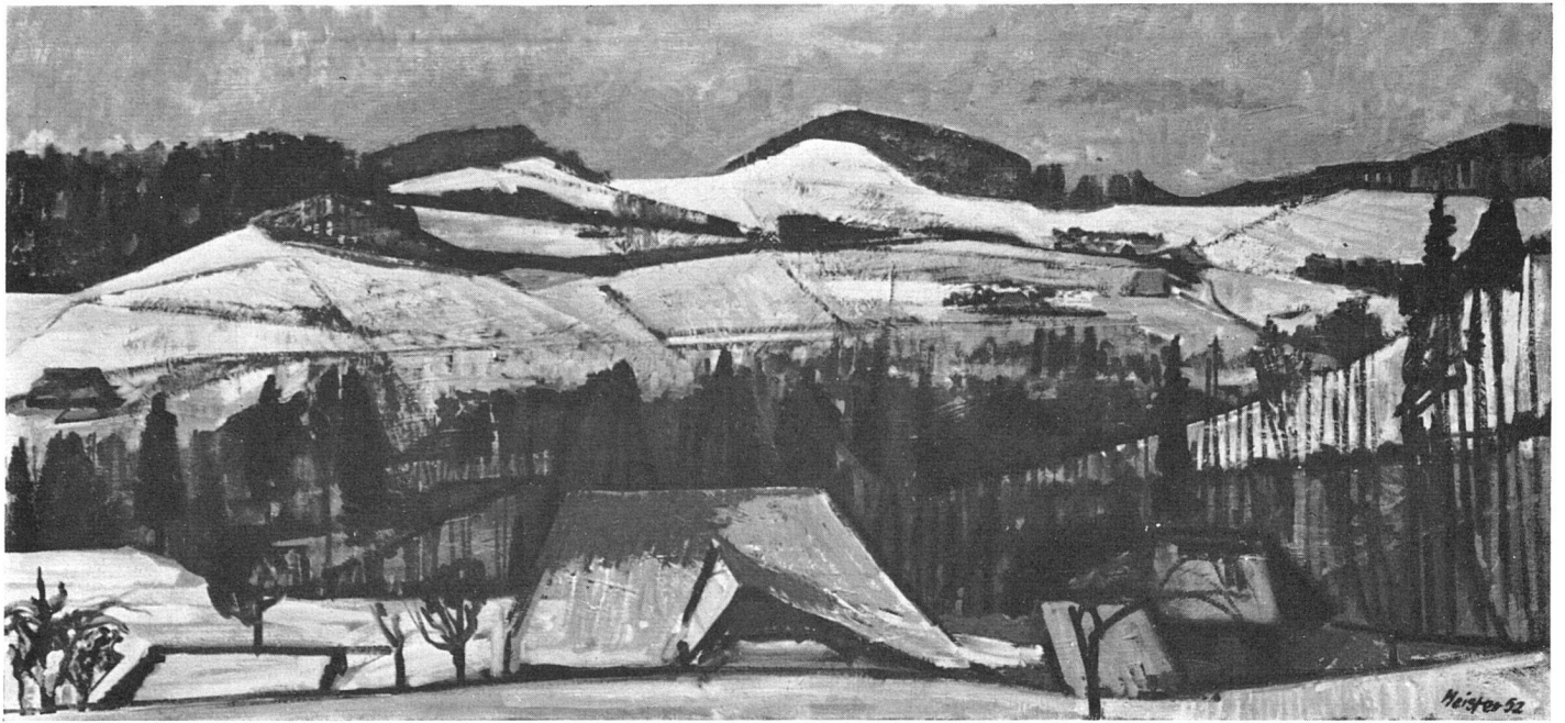
Willi Meister, Emmentalische Landschaft , 1952 | Paysage de l'Emmental | Emmental Landscape