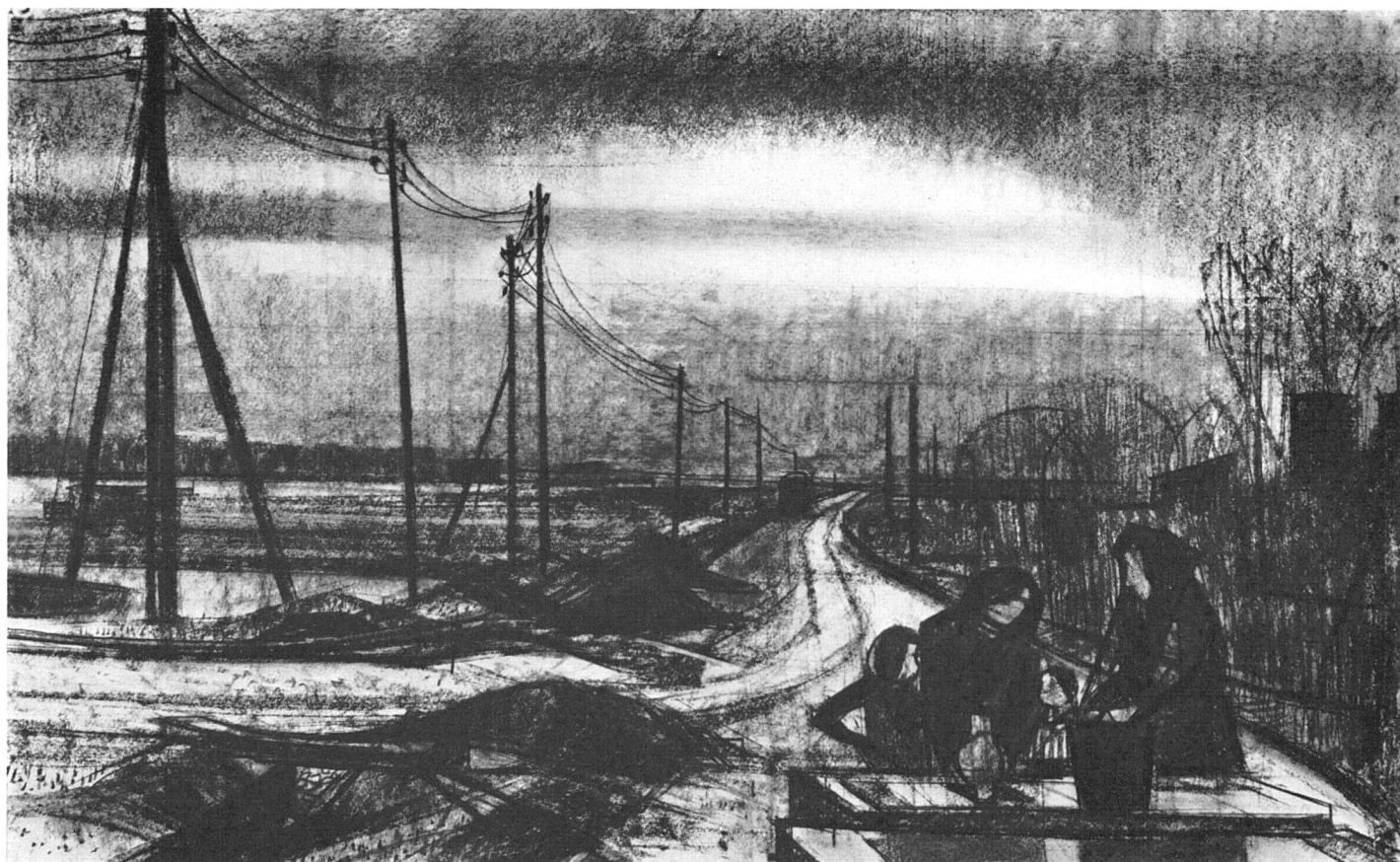
Willi Meister, Familie am Wegrand, 1954. Kohle | Famille au bord du chemin. Fusain | Family by the Roadside. Charcoal

Spätere Bilder zeigen dann in vielfältiger und detaillierter Ausführung, was die Menschengruppe am Straßenrand andeutete: das Beieinander von Familien in der unglaublich harten Wirklichkeit der Zelt- und Barackenstädte unter nordischem Himmelsstrich. Das Gesteige und die Dächer, die Stützen und Röhren sind wiederum da, haben aber hier in ihrer Enge und Unbeholfenheit den Ausdruck von Schranken und Verbarrikadierungen, die den Menschen eingeschlossen halten.