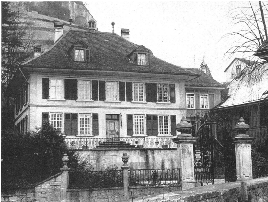
Haus «Zur Burghalde», Lenzburg. Der Neubau von 1793/94 | La maison de la «Burghalde», à Lenzburg | Burghalde House, Lenzburg