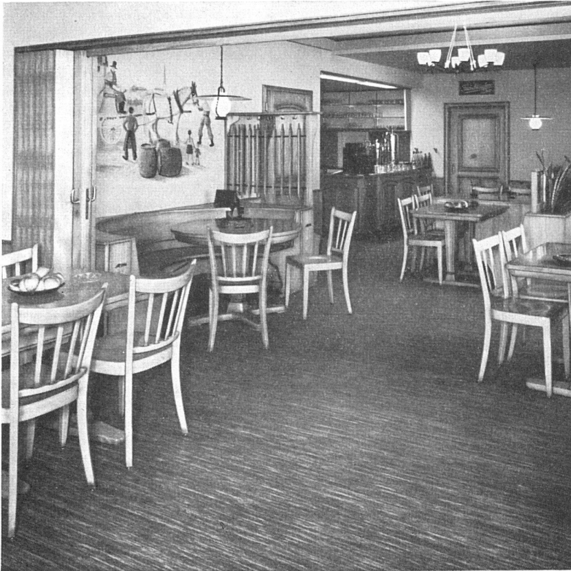
Restaurant „Posthorn“, Neuenhof